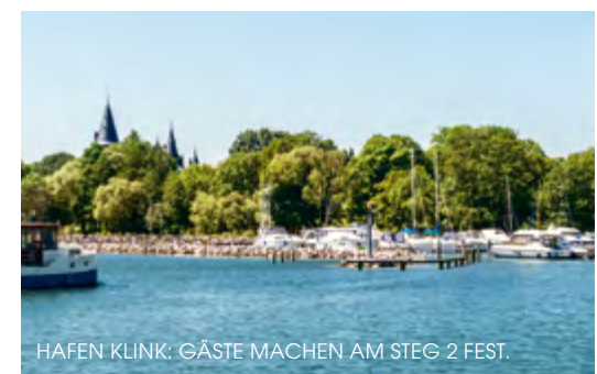
HAFEN KLINK: GÄSTE MACHEN AM STEG 2 FEST.

Boot: MEW, km 153 LU. Am Westufer der Müritz, Gastlieger am ersten Steg festmachen. 125 UBT/20 m/5,20 m/1,40 m 1,50 €/m, zzgl. Kurtaxe 2 €/p.P. EC VISA AmEx Freizeit: 7 m Crew: WC Versorgung: 0,2 km 0,3 km 10 km Freizeit: 0,2 km Wassersport: Übernachtung: 1 km 0,3 km 0,5 km Lage: 1 km 10 km (H) 0,5 km (Taxi) (0 39 91) 18 75 20 Hafenstraße 6, 17192 Klink (0 15 25) 4 15 96 41 oder (0 39 91) 63 47 41 service@hafen-klink.de www.hafen-klink.de Tipps: Landzugang und WC stufenlos erreichbar. Bitte Restaurant-Tipp beachten.