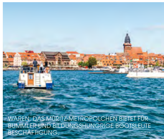
WAREN: DAS MÜRITZ-METROPOLCHEN BIETET FÜR BUMMLER UND BILDUNGSHUNGRIGE BOOTSLEUTE BESCHÄFTIGUNG.